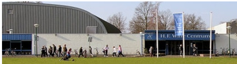
Cultuur- & Vergadercentrum H.F. Witte

Op 8 februari 2020 organiseren wij onze winter-CompUfair in: