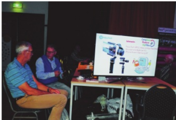
Er is altijd wel gelegenheid om iemand om advies te vragen

Zoals altijd zal het platform DigiVideo (videobewerkingsgroep) ook op de CompUfair van 8 februari in De Bilt acte de présence geven. Bezoekers kunnen ons vragen stellen over de diverse videobewerkingsprogramma's, zoals Power Director van Cyberlink, Magix Videodeluxe, Pinnacle, Lightworks en VirtualDub. En zeer waarschijnlijk kunnen zij met een werkbaar advies huiswaarts gaan.