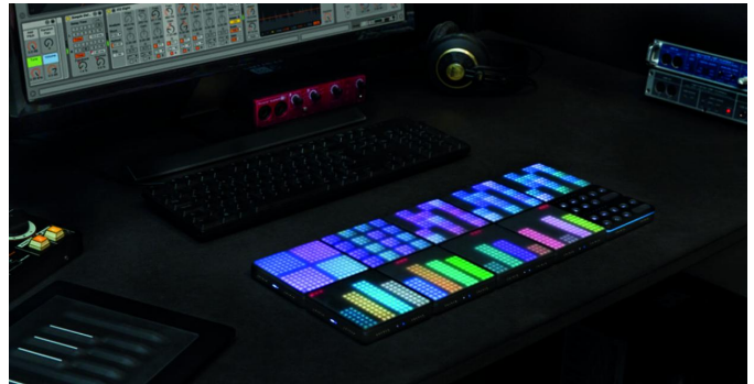
De zogenoemde Roli-blocks

pluggen. Daarbij is het systeem volledig modulair, dus uit te breiden met diverse modules.